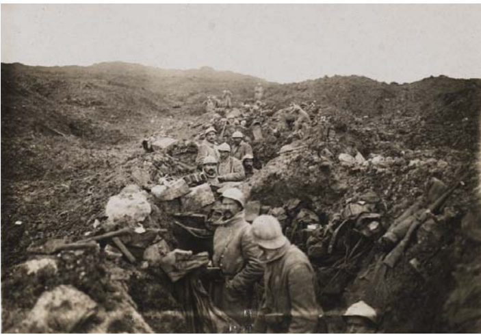
Photographie prise lors de la bataille de Verdun Douaumont. Groupement Mangin, Octobre 1916